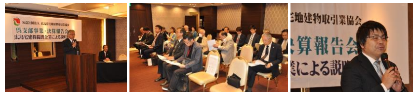
4/18 事業・決算報告会 & 広島宅建(株)提携企業説明会の様子